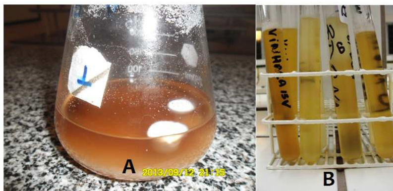
Figura 2. Remoção da cor da vinhaça por P. eryngii . A: após a inoculação dos discos de micélio. B: Após cultivo com P. eryngii .

O estudo de Vive e Rizk (22) analisou o potencial de descoloração da vinhaça com o sistema de tratamento H_2O_2/UV , mas este sistema apresentou percentual de remoção da cor inferior quando comparado com o presente estudo, com só 20% de descoloração. Já Souza et al. (23) utilizaram os sistemas de fotólise e fotocatalise para descoloração da vinhaça e estes sistemas promoveram uma descoloração de apenas 28% e 45%, respectivamente. Isto mostra a eficiência nos sistema de biorremediação em comparação com métodos químico-físicos de remoção da cor.